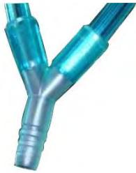
Salter Labs Y-Verbinder