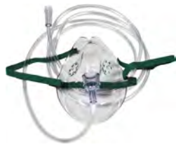
SALTER LABS Salter Labs Nebutech Vernebler