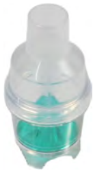
SALTER LABS Salter Labs Vernebler

Der High Density Vernebler (HDN) von Salter Labs ist für den effektiven und effizienten Einsatz in Spitälern und im Home-Care-Bereich unentbehrlich.