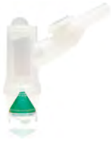
SALTER LABS Salter Labs Nebutech Vernebler