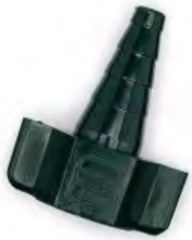
Salter Labs Schlauchnippel