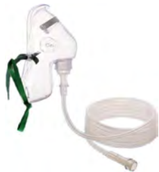
ASID BONZ Sauerstoffmaske für Erwachsene

Die Sauerstoffmasken für Erwachsene sind besonders weich und dadurch angenehm zu tragen. Die Gummiband-Fixierung und der Nasenclip sorgen für einen sicheren Sitz. Sie sind geruchsneutral und klinisch rein verpackt.