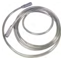
SALTER LABS O2 Schläuche

Ersatzschläuche für Sauerstoffbrillen und -masken sowie zur Inhalation bestehen aus Vinyl. Sie sind beidseitig mit Anschlussmuffen von 4,6 bis 15 m Länge ausgestattet und sowohl transparent als auch in augenfälligem Grün erhältlich.