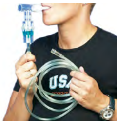
servoprax Vernebler-Set mit Mundstück

Für Patienten, die ihre Atmung koordinieren können, kann dieser Vernebler mit Mundstück eingesetzt werden. Hierbei wird der Anteil des Aerosols erhöht, welches in die Lunge eindringt und damit auch der Grad der Deposition.