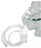
ASID BONZ Vernebler-Sets - für trachobronchiale & alveoläre Applikation

Das Vernebler-Set wurde im Hinblick auf die Handhabung besonders patientenfreundlich konstruiert. Gummiband-Fixierung und Nasenclip ermöglichen ein komfortables Tragen in senkrechter und schräger Lage.