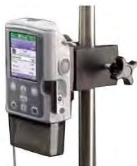
smths medical Zubehör zur Befestigung am Infusionsständer für CADD-Pumpen

Verriegelbare und nicht verriegelbare Infusionsständerhalterung gleitet in die Aussparung am Halterungsadapter oder an der LockBox und ermöglicht so die Befestigung der Pumpe oder der LockBox am Ständer.