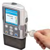
smths medical Ersatzteile für CADD-Pumpen