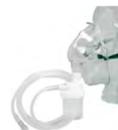
ASID BONZ® Vernebler-Sets - für tracheobronchiale & alveoläre Applikation

Das Vernebler-Set wurde im Hinblick auf die Handhabung besonders patientenfreundlich konstruiert. Gummiband-Fixierung und Nasenclip ermöglichen ein komfortables Tragen in senkrechter und schräger Lage.