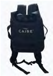
CAIRE® AirSep Freestyle Comfort Rucksack