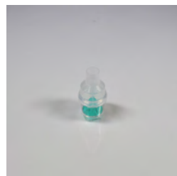
SALTER LABS® Vernebler

Der High Density Vernebler (HDN) von Salter Labs ist für den effektiven und effizienten Einsatz in Spitälern und im Home-Care-Bereich unentbehrlich.